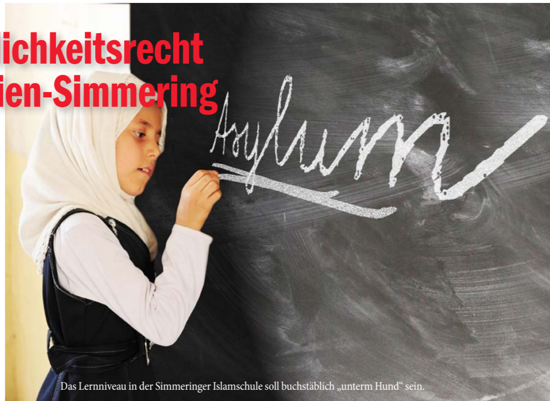
Das Lernniveau in der Simmeringer Islamschule soll buchstäblich „unterm Hund“ sein.

Schule steht Milli Görüs nahe Der Kurier hat am 6. September darüber berichtet, dass die Neue Mittelschule in der Forian-Hedorfer-Straße 21 vom Bildungsministerium doch noch rückwirkend das Öffentlichkeitsrecht zugesprochen bekam. Bei dieser Einrichtung handelt es sich um die Islamschule des Vereins „Solmit“ (Solidarisch miteinander). Sie steht der Islamischen Föderation und somit der Gemeinschaft der Milli Görüs nahe.