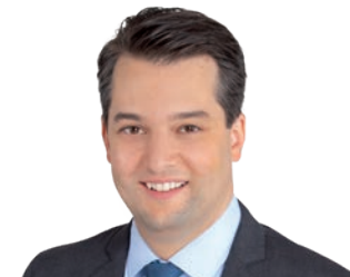
Vizebürgermeister Dominik Nepp

Es gibt eine Menge zu kritisieren an der rot-grünen Stadtregierung. Was mich aber besonders ärgert ist, dass bei der SPÖ und bei den Grünen die direkte Demokratie auch noch im 21. Jahrhundert in den Kinderschuhen steckt. Ich trete in Wien als Bürgermeisterkandidat an, um die Bürger endlich zu „Meistern“ zu machen. Das heißt: Die Menschen sollen das Sagen haben, wenn über ein umstrittenes Projekt oder eine wichtige Infrastruktur entschieden werden soll.