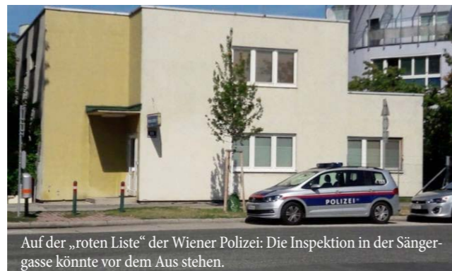
Auf der „roten Liste“ der Wiener Polizei: Die Inspektion in der Sängergasse könnte vor dem Aus stehen.

Seit bekannt wurde, dass mitten in der Urlaubszeit nahezu überfallsartig die Polizeiinspektion Gersthofer Straße in Wien-Währing geschlossen wird, läuten auch im elften Wiener Gemeindebezirk die Alarmglocken. Denn auch das Wachzimmer in der Simmeringer Sängergasse befindet sich auf jener Liste, die zur Schließung vorgesehene Stationen beinhaltet.