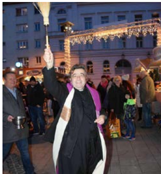
Pater Jan segnete auch heuer wieder den Simmeringer Christkindlmarkt

Mit einem stimmungsvollen Rahmenprogramm, Kunsthandwerk, Kut-schenfahrten, Werkstatt für Kinder mit Keksbäcken und tollen Künstlern feiert der Bezirk zum dritten Mal den Simmeringer Christkindlmarkt vor der Kirche auf dem Enkplatz.